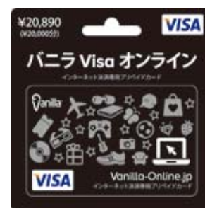
バニラ Visa オンライン 20890

コネクシオは、今後も新たなサービスの拡充を図り、コンビニチェーンをはじめとした小売事業者向けの様々なサービスを展開して参ります。