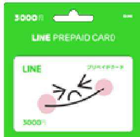
LINE プリペイドカード 3000