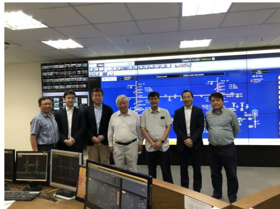
KHPC の社屋とオペレーションルームを見学させていただきました。