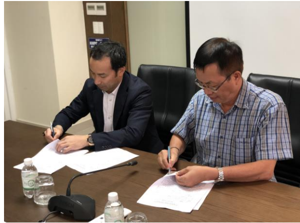
KHPC 社長との締結の様子