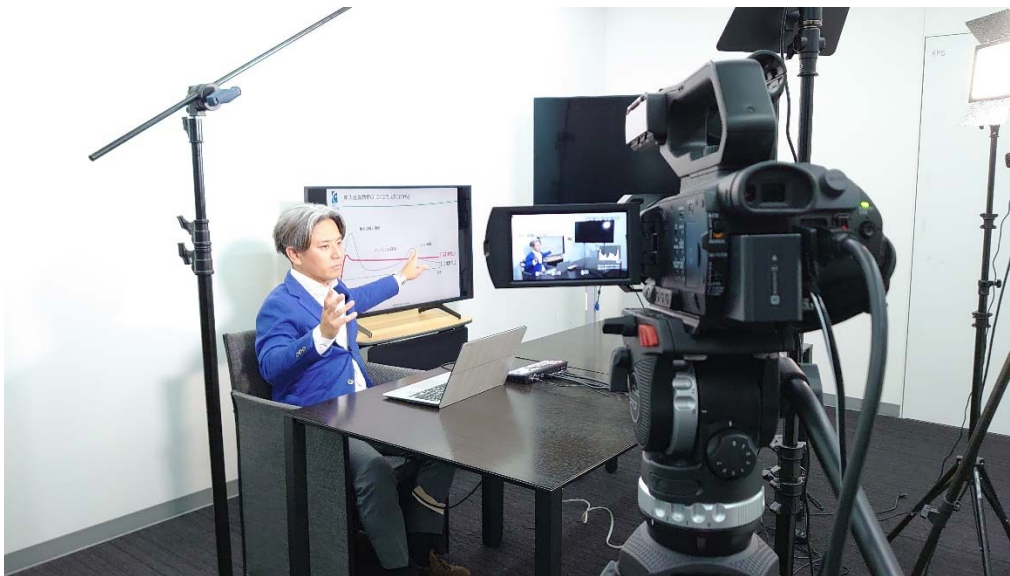
【新設された映像撮影スタジオでのライブ配信イメージ】

アフターコロナを見据え、セルムは、集合・対面で得られる効用とオンライン研修の利点の両方を活かし、ベスト・ミックスを追求するハイブリッドな研修のデザインに取り組んでいます。この度、開設した映像撮影スタジオは、より品質の高いライブ配信やオリジナルの動画コンテンツの制作を容易にし、「ハイブリッド研修」デザインの実現を加速します。