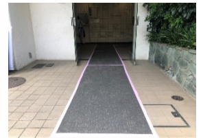
■リサイクル養生シート