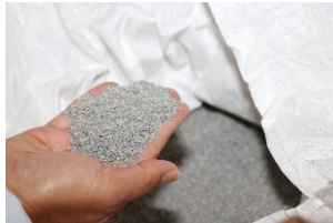
■再生樹脂パウダー