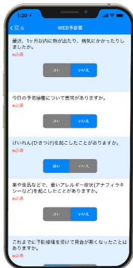
◇アプリ内WEB 予診票画面イメージ