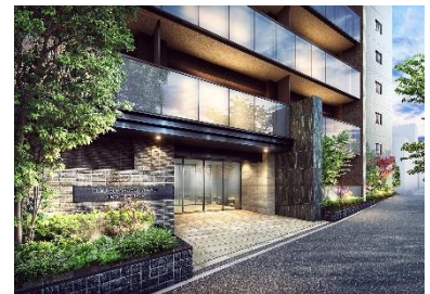
エントランス完成予想図 (※6)

https://www.meiwajisyo.co.jp/clio/881_Gumyoji/