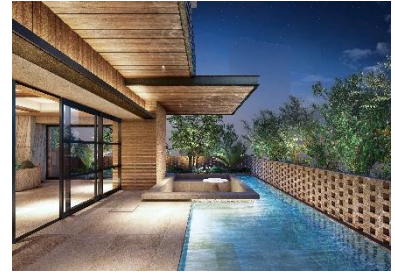
水盤ラウンジ完成予想図（※6）

https://www.meiwajisyo.co.jp/cliio/875_Enoshima/