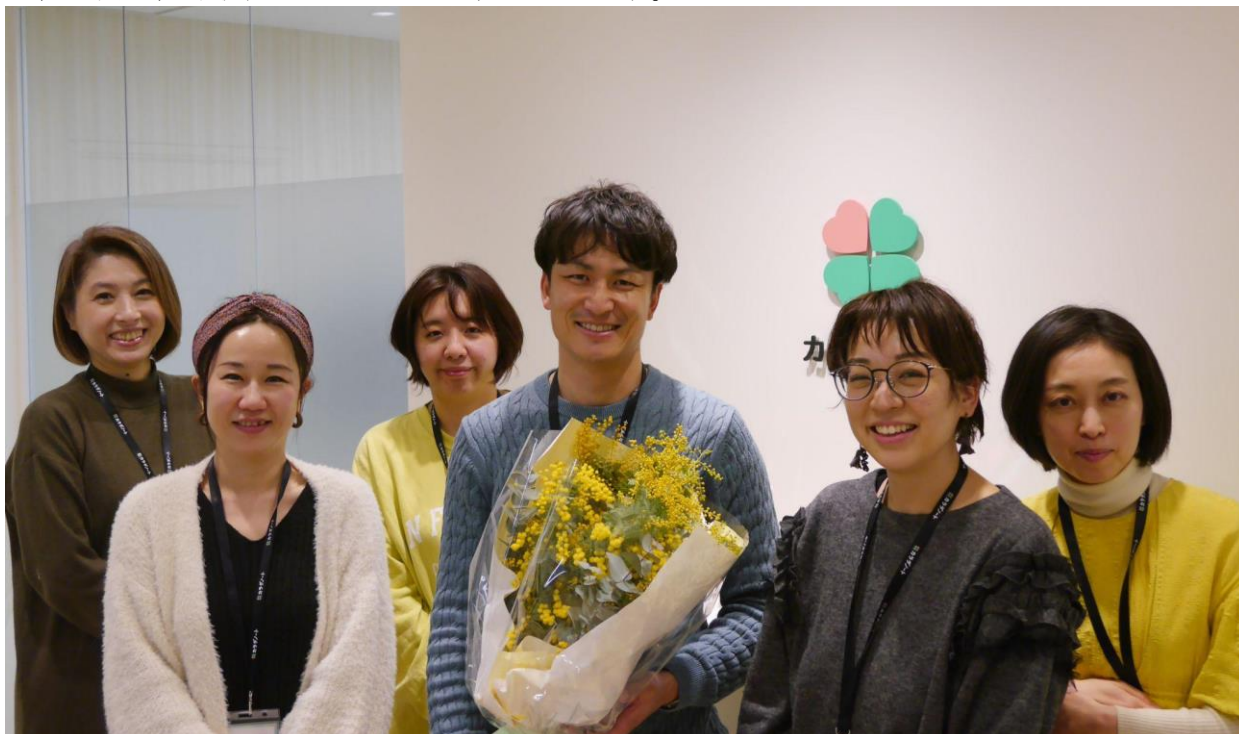
（当日は代表佐藤より花束のプレゼントを頂きました）

「家族の健康を支え笑顔をつやませる」をビジョンとし、家族と向き合う全ての人のアシスタントとして心身ともに健康な生活を支援する事業会社である株式会社カラダノート（東京都港区/代表:佐藤竜也/以下当社）は、3月8日の「国際女性デー」を記念し、当社の女性雇用に関する社内及び社外取組のレポートを公開いたします。