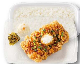
おろしチキン竜田弁当（香味醤油／和風ぼん酢） 490円