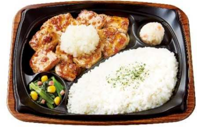
おろしポークステーキプレート 790円

「ほっともっとグリル」初となる、“ポークステーキ”が登場です。ポークステーキは食欲が落ちやすい時期も美味しく召し上がっていただけるよう、脂身が少なくあっさりとした味わいが特長の豚もも肉を採用し、玉葱の旨味を加えた肉によく合う和風ソースを絡めました。そのままでも美味しく味わえますが、大根おろしと合わせていただくとさっぱりとお召し上がりいただけます。また、お好みで別添のだし醤油をかけて、味の変化をお楽しみください。