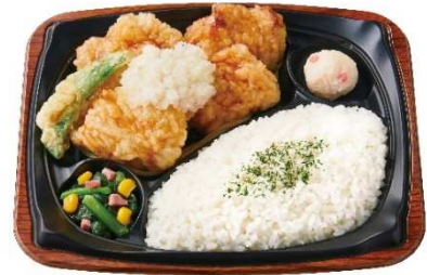
おろしとり天プレート 540円

『おろしとり天プレート』は、とり天を4個盛りつけた食べ応えのある商品です。とり天は下味をつけた鶏もも肉を、店内でひとつひとつ衣をつけて揚げています。鶏肉の旨みを存分に味わえるよう仕立てました。大根おろしをのせ、ゆず・すだち・かぼす・だいたい・レモンの5種の柑橘果汁を使用した“和風ぼん酢”をかけていただくことで、ジューシーなとり天をさっぱり美味しくお召し上がりいただけます。