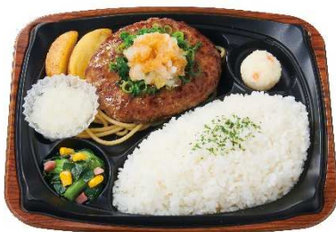
グリルハンバーグプレート（おろしぼん酢） 670円※1