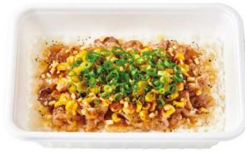
ペッパー焼肉 BOX 500 円