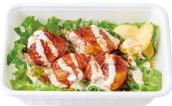
チキンオーバーライス BOX 500 円