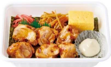
とりめし BOX 460 円