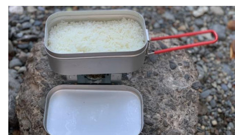
加熱調理ができる「携帯用炊飯器」