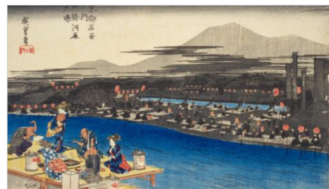
「納涼 京都名所之内 四条河原夕涼」

時代は変わって「野遊び」は、ピクニックや現代でも流行しているキャンプと呼ばれるようになります。野外で食事を楽しむため、食器がセットになった弁当箱や加熱調理ができる携帯用炊飯器へと進化し、楽しみ方も変化してきました。時代が変わっても季節と自然を楽しむ「野遊び」を、弁当箱とともに紹介していきます。