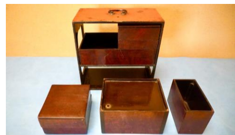
酒器が付いた弁当箱「提重」