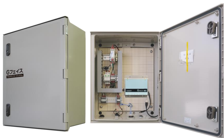
Gフェイスルーターボックス(GFC-100A)