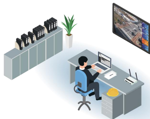
屋内設置時の利用シーン(一括表示システム)