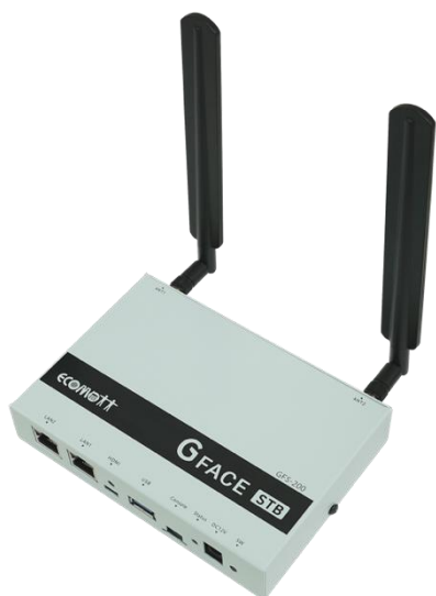
Gフェイスセットトップボックス(GFS-200)

Gフェイスの主要コンテンツはクラウド上に構築されているため、セットトップボックスを使用してデータを受信しサイネージ(ディスプレイ等)に表示を行う必要があります。そのための機器として、セットトップボックスと野外設置用制御盤（Gフェイスルーターボックス）を提供いたします。