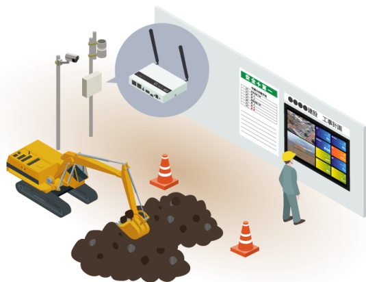
野外設置時の利用シーン

Gフェイスは屋内・屋外いずれにも使用可能である為、様々な利用シーンが考えられます。建設現場向けにはもちろん、屋外の場合は、野外音楽フェスや、お祭りなどにおける情報表示用サイネージ等としての使用も可能です。一方屋内の場合は、建設現場の監視用として現場事務所での使用や、監視カメラ管理用途としての使用が可能なシステム構成となっています。