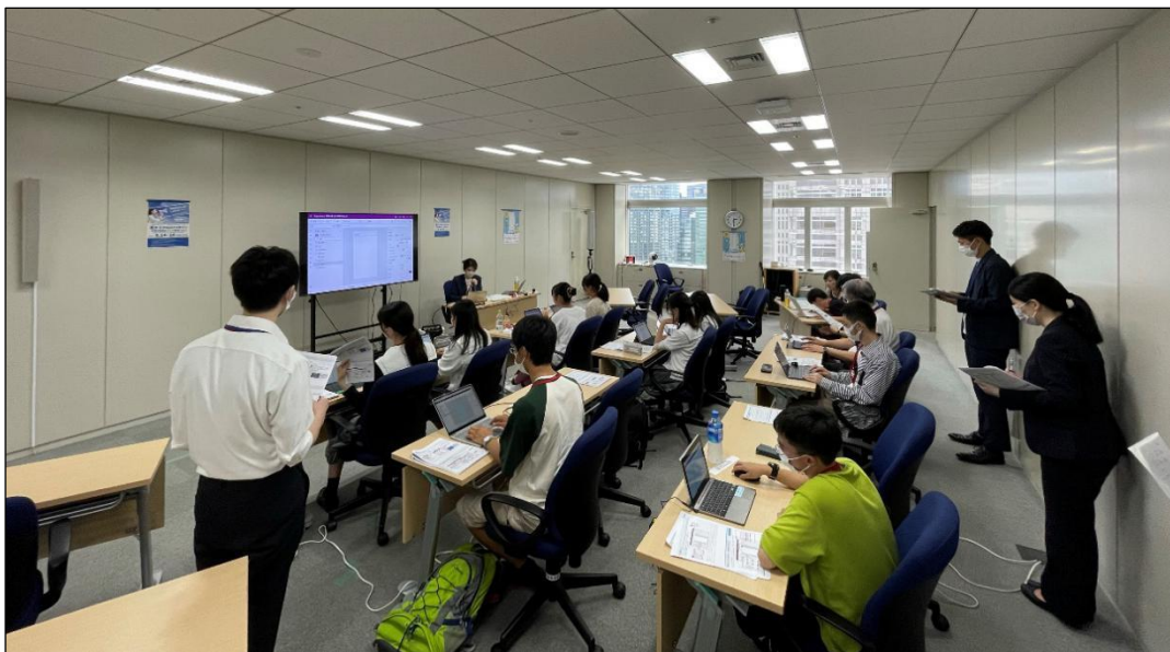
▲ワークショップの様子

内 容：Microsoft Power Platform（※ 2）を使い、アプリの設計から開発まで体験する中高生向けカリキュラムを提供。講師やメンターをヘッドウォータースグループ社員が務めました。