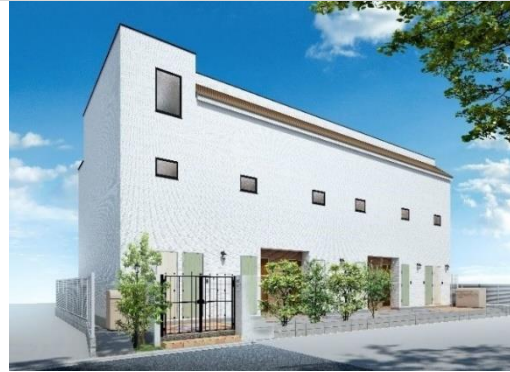
新築1棟投資用賃貸アパート「MIJAS（ミハス）」