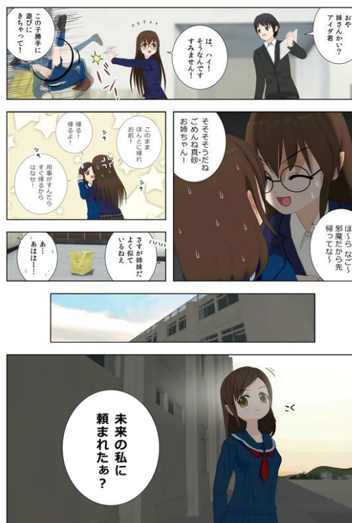
コミ Po! 完成作品例