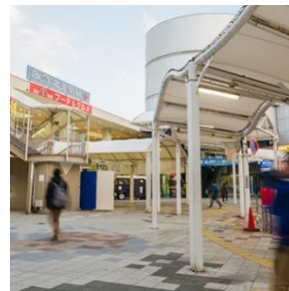
阪急千里線「北千里」駅