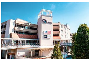
みのおキューズモール

「ららぽーと EXPOCITY」などの大型商業施設をはじめ、多彩な便利施設が日常を彩ります。