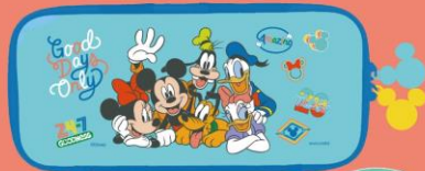
Nintendo Switch Lite専用 スマートポーチ EVA ミッキー&フレンズ(ミント)