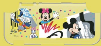
Nintendo Switch Lite専用 ハードカバー ミッキー&フレンズ