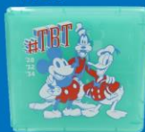
Nintendo Switch 専用カードケース カードポケット24 ミッキー&フレンズ(ミント)