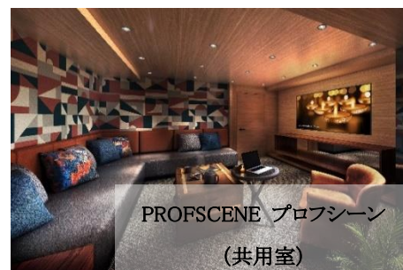
PROFSCENE プロフシーン (共用室)

ネベル草加アートフィロスでは、各居住スペース以外にも、サードスペースとしてのエントランスホールや、2F 共用部ではご家族やご友人と、誕生日や記念日などの素敵な空間をカラオケで楽し