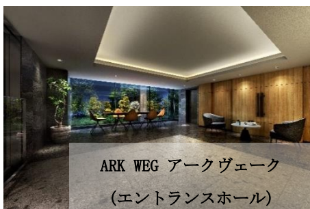
ARK WEG アークヴェーク (エントランスホール)