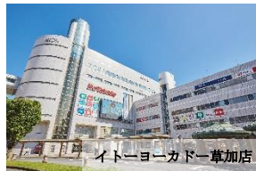
イトーヨーカドー草加店