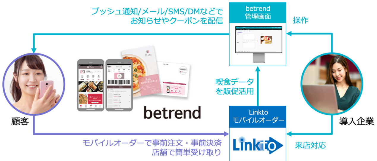
図2 『Linkto モバイルオーダー』連携イメージ