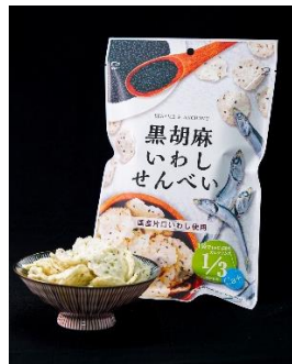
黒胡麻いわしせんべい