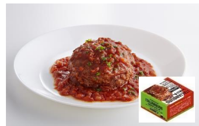
鯨イタリアンバーグ