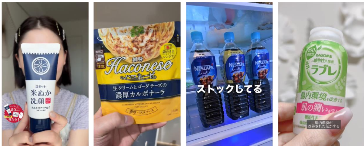
▲「#タテガタセダイ」を活用し、作成できる動画のイメージ

EC サイトの売上向上には、動画自体の質も重要です。縦型ショート動画に特化した動画制作支援サービス「#タテガタセダイ」は、縦型ショート動画の知見が豊富なクリエイターやインフルエンサーに直接制作が依頼できるため、低コストかつスピーディーに、ショート動画 SNS の文脈を理解した「ユーザーに支持される効果的な動画」を提供できます。