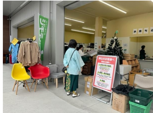
ジモティースポットの様子(写真はジモティースポット名古屋)