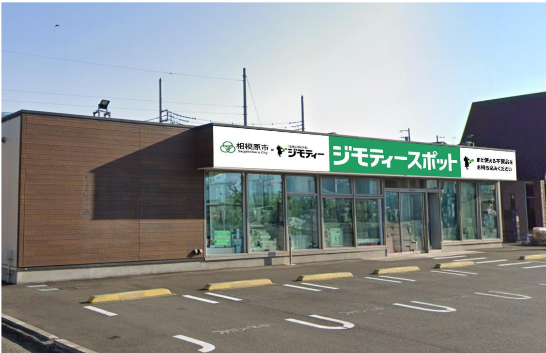
ジモティースポット相模原の店舗外観