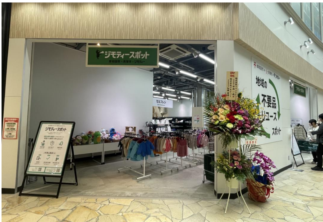
ジモティースポット岸和田・貝塚の店舗外観