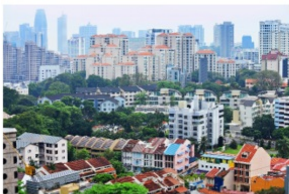
<シンガポール住宅街>

東南アジアの人口は約6億6,000万人で、近年、一人当たりの所得の向上に伴い名目GDPも急速に増加しており、2030年までには日本を上回る見込みです。(図1参照)